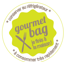
Sticker boîte (5 cm)