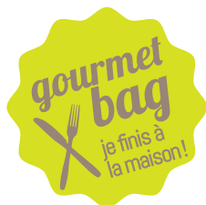
Sticker vitrine (11 cm) + sticker menu (3 cm)